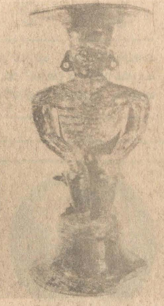
സുഗന്ധ ധൂമം ഉൽപാദിപ്പിക്കാൻവേണ്ടി തീയിടുന്നതിന് ഒരു പാത്രം. കളിമണ്ണിൽ തീർത്തത്. കാലം ബി. സി. 500 മുതൽ എ. ഡി. 500 വരെ, ഇക്വഡോറിൽ നിന്ന്.

കലാവിവേങ്ങര നഗീപ്പിക്കുകയോ കൊള്ളചെയ്യപ്പെടുകയോ ചെയ്തിട്ടുള്ളതിന്റെ കഥകൾ പറയാൻ തുടങ്ങി